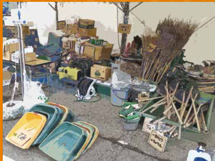
活動に使用する資機材