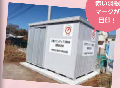
赤い羽根共同募金の助成を受けて設置しました。

泉区では、ゆめが丘駅近くの「自立援助ホーム NEXT」様のご厚意により、敷地内に災害ボランティア用資機材倉庫を設置させていただいております。