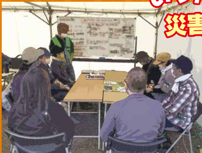
ボランティア活動者への事前オリエンテーション